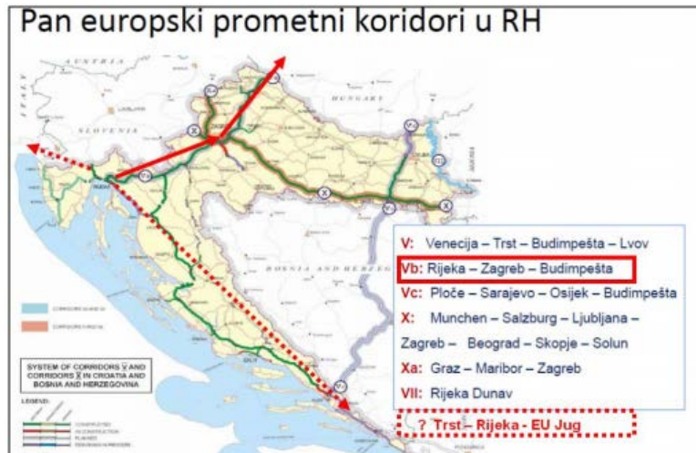
Slika 1: Pan europski prometni koridor

Ovakav povoljan geoprometni položaj omogućuje Županiji i Gradu ostvarivanje značajnih gospodarskih tokova roba i putnika te nudi mogućnost gospodarskog napretka, ali ga tek treba značajnije eksploatirati. Osim toga, geostrateški položaj Županiji daje mogućnost pozicioniranja kao energetskog i prometnog čvorišta, ali i pristupačne turističke destinacije.